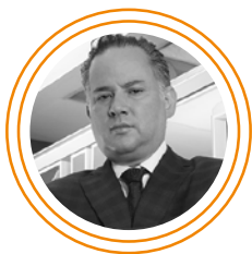
DR. SANTIAGO NIETO CASTILLO

Titular de la Unidad de Inteligencia Financiera